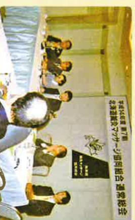
創立5周年記念祝賀会(平成12年9月)と平成14年度通常総会の模様。スチールカメラで撮影したものです。皆さん、若い!