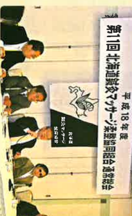
こちらはデジタルカメラ撮影。多分200万画素。